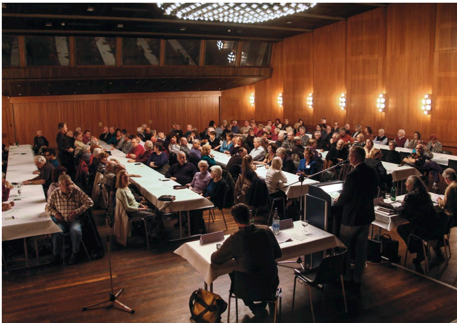
120 Personen sind der Einladung für die ausserordentliche Generalversammlung gefolgt. 87 Stimmberechtigte machten von ihrem Recht Gebrauch, bei der Weiterentwicklung der BG Süd-Ost mitzureden.

Die nächste Generalversammlung findet am Donnerstag, den 23. Mai 2013 statt. Eine gute Gelegenheit, sich über den Geschäftsgang und die aktuellen Projekte Ihrer Genossenschaft zu informieren.